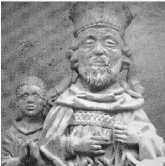
SINT-NIKOLAAS met ZWARTE PIET. Anno 1600. Detail.

Is dit ZWARTE gezicht een imitatie van de donkere bewoners van de gewezen kolonies? Of is het een spottende uitbeelding van een slaaf, slachtoffer van de gruwel van de slavenschepen en de Amerikaanse katoenvelden? Deze rumoerige en bitsige discussie wordt in dit boek slechts zijdelings aangeraakt want we gaan op zoek naar het ware wezen van de ZWARTE BEGELEIDER van de WITTE BISSCHOP.