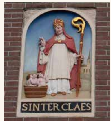
Gevelsteen op de Dam.

Dat de legendarische exploiten van de HEILIGE de band leggen met allerhande beroepsgroepen, zorgt ervoor dat heel wat gilden en ambachten zich deze als patroon toe-eigenen. Zo krijgt hij het patronaat over allerhande handelaars, zeelui, beenhouwers, bakkers, kuipers en brouwers, laken- en linnenbewerker, zelfs juristen.