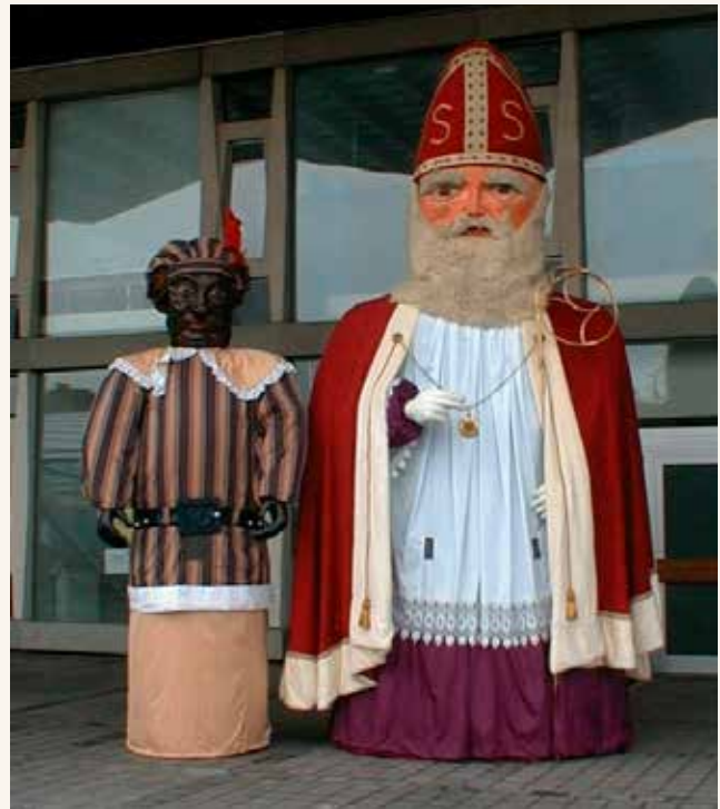
De Heilige NICODEMUS begeleidt SINTERKLAAS in Sint-Niklaas (1930).