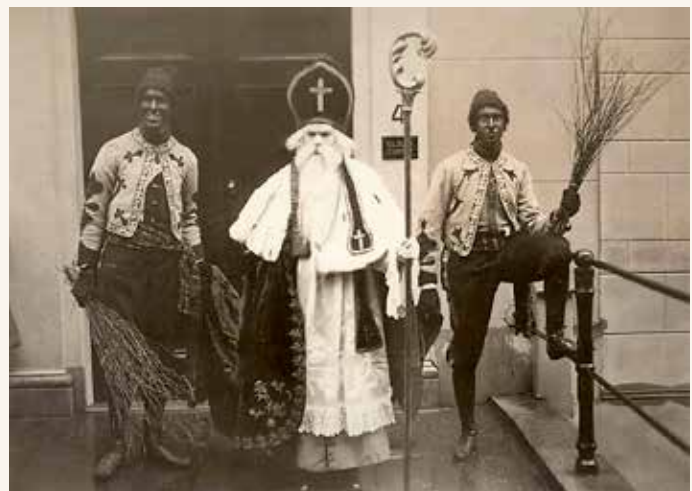
De SINT met twee ZWARTE BEGELEIDERS. Utrecht 1913.

In een tweede hoofdstuk gaan we op zoek naar de herkomst van het verhaal over SINTERKLAAS. In de Middeleeuwen liepen in de Nederlanden en ook in de rest van Europa groepen scholieren rond die SINT-NICOLAAS op hun manier vereerden. De cultus voor deze heilige nam allerlei vormen aan. Maar niet enkel de jeugd vereerde de heilige. Hij was ook een HUWELIJKSMAKER. Kortom! Wie een lief zocht, brandde een kaars voor de bisschop. De beide kindervrienden hadden nog een andere belangrijke functie. Ze moesten de kinderen disciplineren. Begin december was het geschikte moment voor de ouders om de 'pedagogische rekening' te presenteren aan hun turbulente kroost. De optredens van de ZWARTE BEGELEIDER van de SINT moeten bekeken worden als een